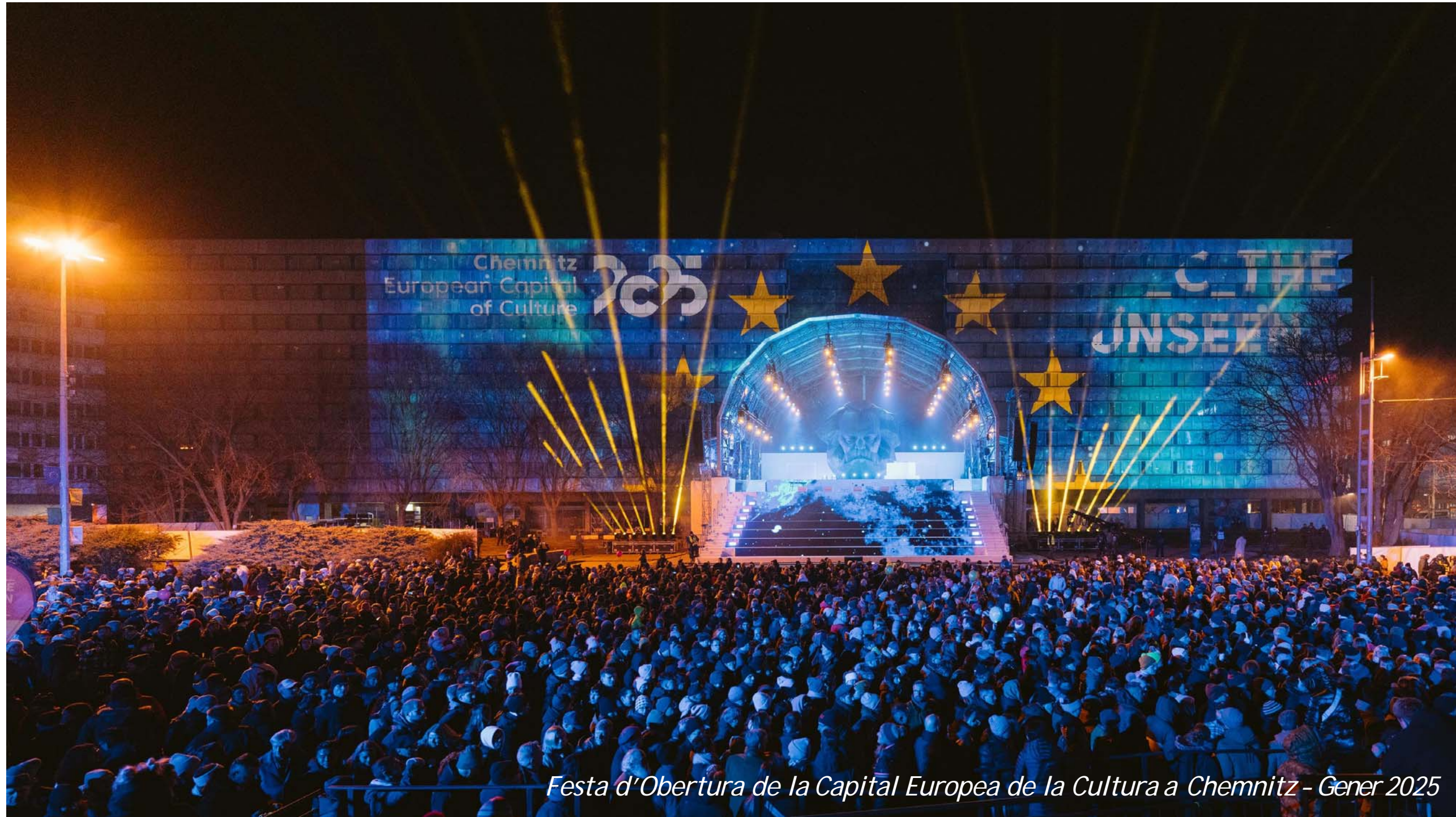
Festa d'Obertura de la Capital Europea de la Cultura a Chemnitz - Gener 2025