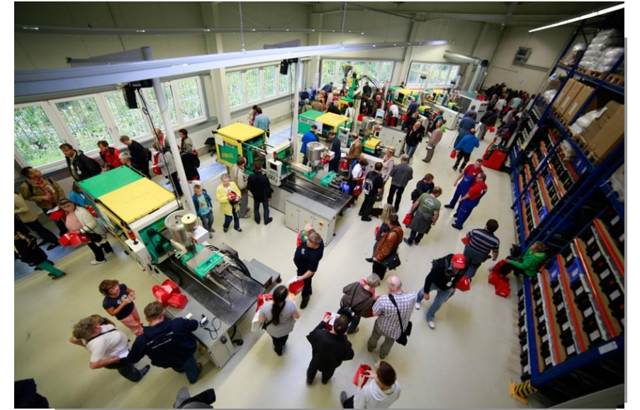
Fabrication of Auhagen