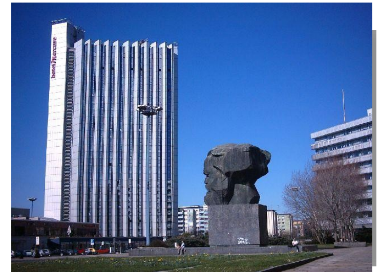
Congress Hotel Chemnitz