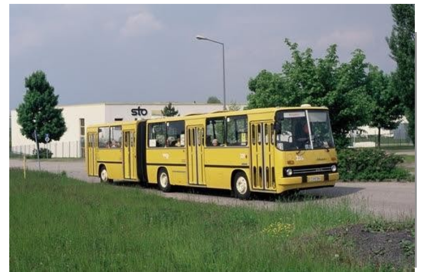
Historic bus for city tour