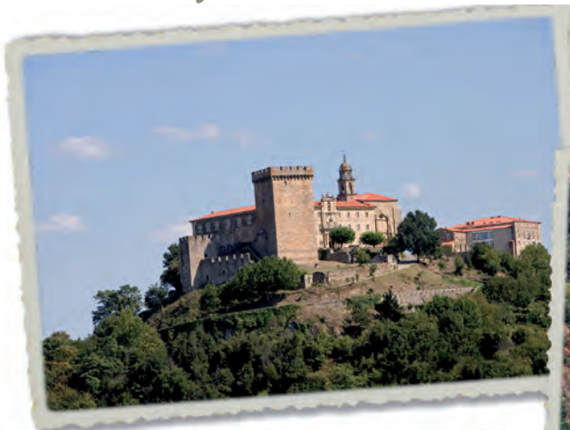
Monforte, Capital da Ribeira Sacra

... o tren que te leva pola beira do Miño